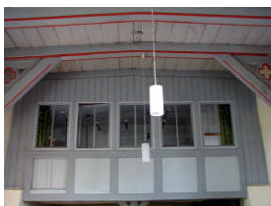
Blick zur Winterkirche

Einweihung der Winterkirche in der Kirche Wenddorf, am 5.12.2010 um 14:30 Uhr Gottesdienst mit Superintendent Uwe Jauch, danach: Kaffeetrinken im Bürgerhaus, Bilder zum Baugeschehen, 17:00